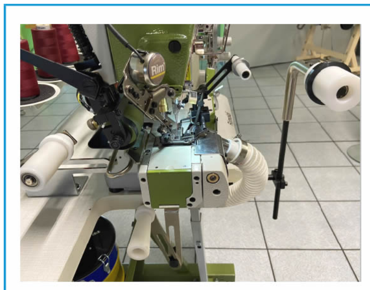
RULLI TENSIONATORI (RTP) /TENSIONING DEVICE (RTP)