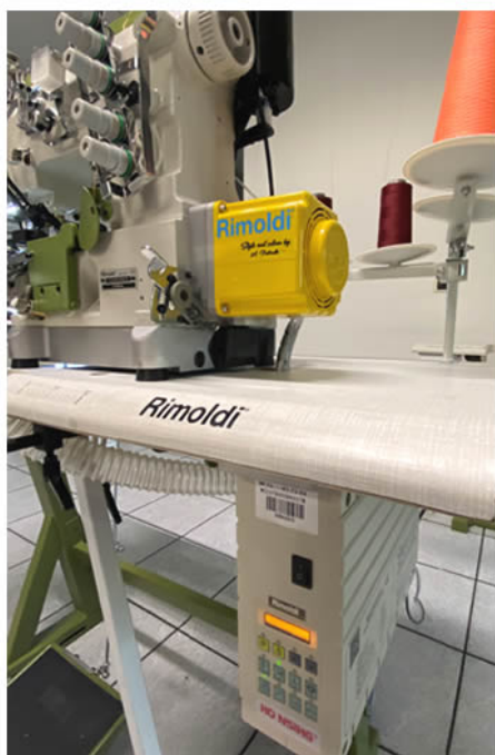
MOTORE DIRECT DRIVE / DD MOTOR