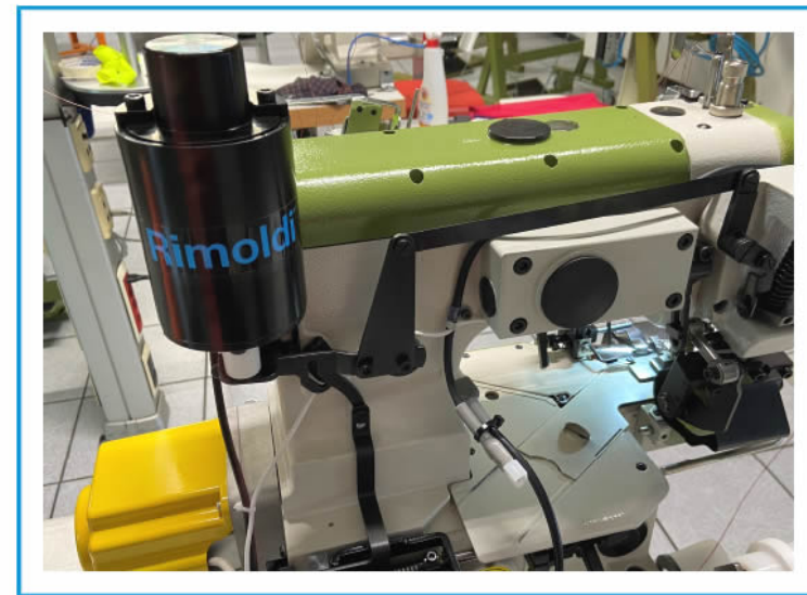
GRUPPO ALZAPIEDINO FOOT LIFTER AY