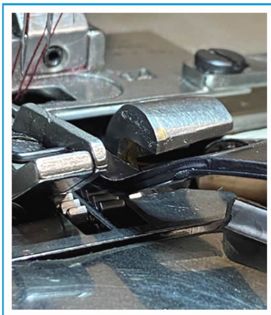
COLTELLO RIFILATORE TRIMMING KNIFE