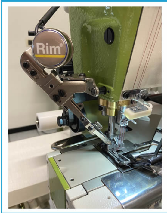
GRUPPO RASAFILO THREAD TRIMMER AY