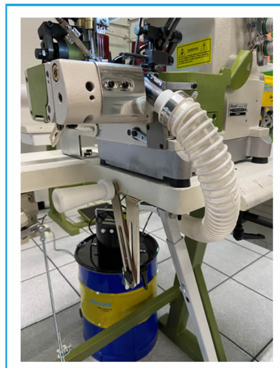
BIDONE ASPIRARITAGLI VACUUM CLIPPINGS BIN